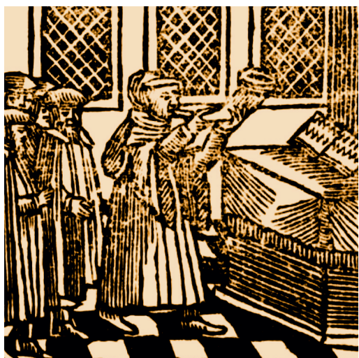
Sefer minhagim, Amsterdam 1723