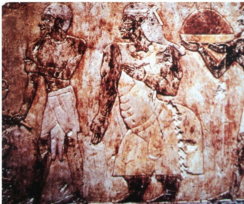
7. Egipski relief przedstawiający mężczyznę i idącą za nim chorą kobietę, 1516–1481 p.n.e. Opis w tekście [5], Świątynia Hatszepsut, Deir el-Bahari, Egipt