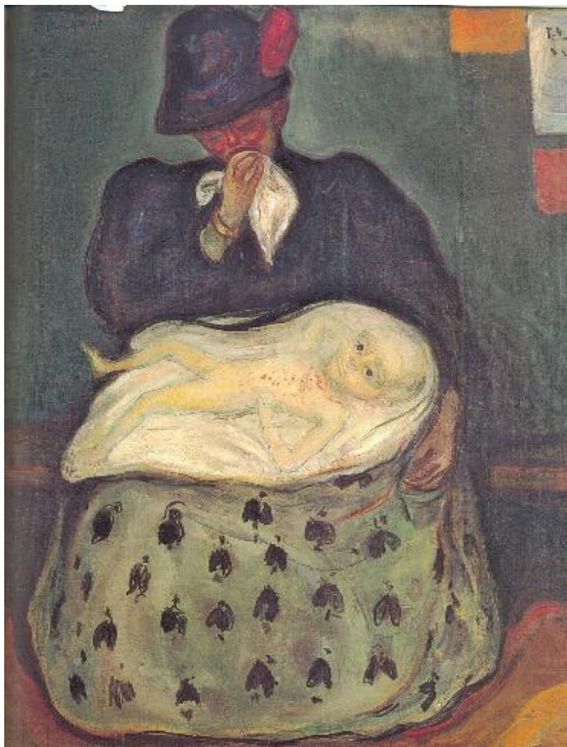
14. E. Munch (1863–1944), Spadek (matka z dzieckiem przypuszczalnie chorym na epidermolysis bullosa ) [5], Muzeum Muncha, Oslo