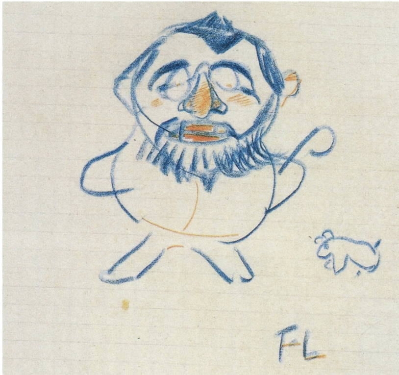
16. H. de Toulouse-Lautrec (1864–1901), karykatura własna, opis w tekście [3]