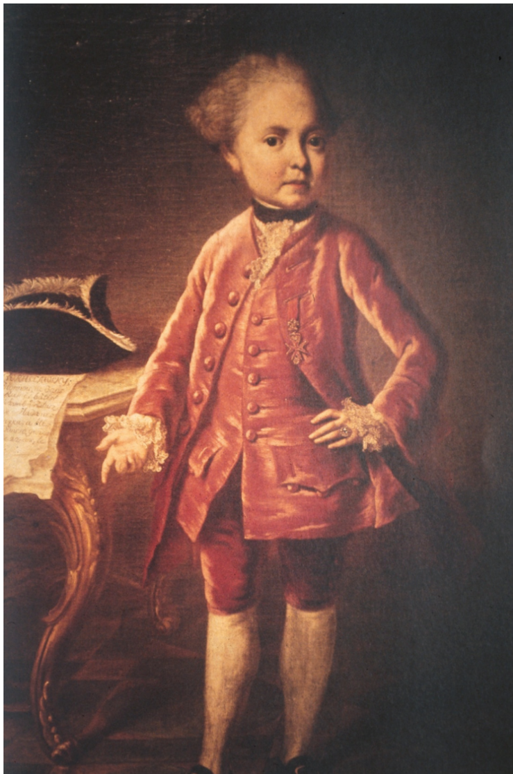
9. Artysta nieznany, portret karła – hrabiego Józefa Boruwłaskiego (karłowatość o niejasnej etiologii), Muzeum Narodowe w Krakowie [5]