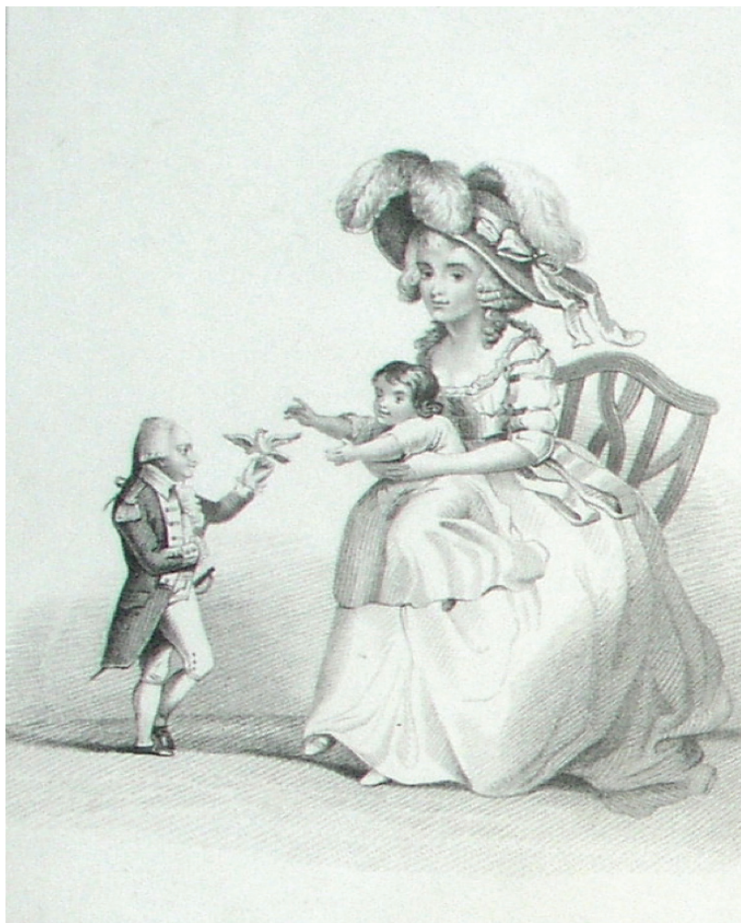
10. Artysta nieznaný, grafika pt. Polski karzeł – hrabia Józef Boruwlaski wraz z żoną i zdrową córką, Londyn, 1820, zbiory własne [8]