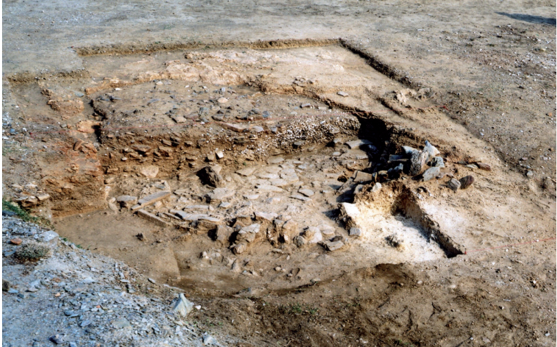
Phot. 4. Maroulas, Kythnos island, Cyclades, Greece. Polish-Greek excavations of the dwelling structure no 15

Littoral adaptations occurred as well at the Early Holocene sites in the Aegean Sea islands. The inhabitants of the Early Mesolithic site of Maroulas in the island of Kythnos (beginning of the IX millennium cal. BC) exploited mainly near-shore marine resources (seasonal migrating fish such as tuna, bonitos, mackerels, also near-shore fish such as morays, konger, eel, grouper, scorpion fish and seabreams [Mylona 2010]), also land snails [Alexandrowicz 2010]. However, also found at this site were bones of mammals such as: suids, hare, fox, and marten [Trantalidou 2010]. Sites of the Aegean islands (including: the Cyclope Cave on the island of Gioura [Sampson ed. 2008], and Kerame on the island of Ikaria [Sampson et al. eds 2012], Roos on the island of Naxos and the site of Areta on the island of Chalki [Kaczanowska, Kozłowski 2014a; Sampson et al. in print] are characterized by flake industries dominated by notched/denticulated tools, retouched flakes and end-scrapers. A semi-sedentary way of life is typical of sites on the islands and is confirmed by the presence of stone dwelling structures on a round plan (Phot. 4), with burials underneath the floors or in the areas in between dwellings – such as were discovered at Maroulas [Sampson et al. eds 2010]. Elements like these, together with a large component of grinding stones appeared, in all likelihood, in the effect of contacts between the Aegean Sea basin and the Near East. Important evidence