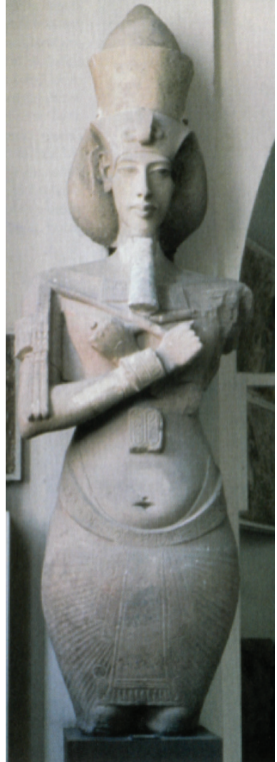
13. Rzeźba faraona Echnatona (Amenhotep IV), 1375–1358 p.n.e. (rozpoznanie: zespół Marfana?), Muzeum Egipskie, Kair