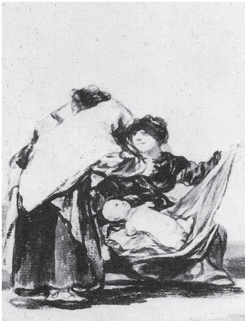
11. F. J. Goya (1746–1828), Matka z chorym dzieckiem (tetrafokomelia) [5], Muzeum Louvre, Paryż