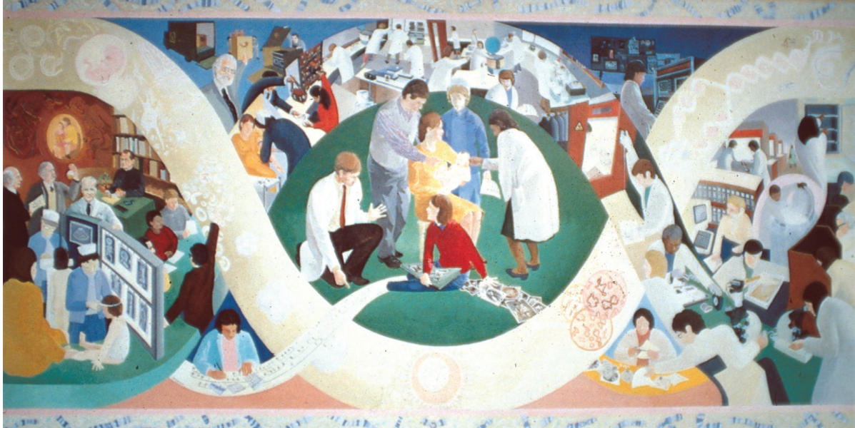
17. Chalk T., Grime P., Wilkinson D., mural pt. Genetyka medyczna w zapobieganiu kalectwu , The Duncan Guthrie Institute, Glasgow, Szkocja [5]