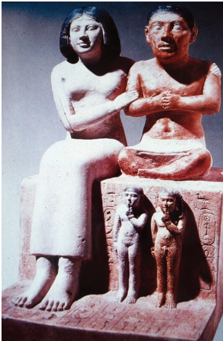
6. Egipcjanin Seneb (chory na achondroplazję) wraz z żoną i dwojgiem zdrowych dzieci, Giza, Egipt, V Dynastia, 2563–2423 p.n.e., Muzeum Egipskie, Kair [5, 10]