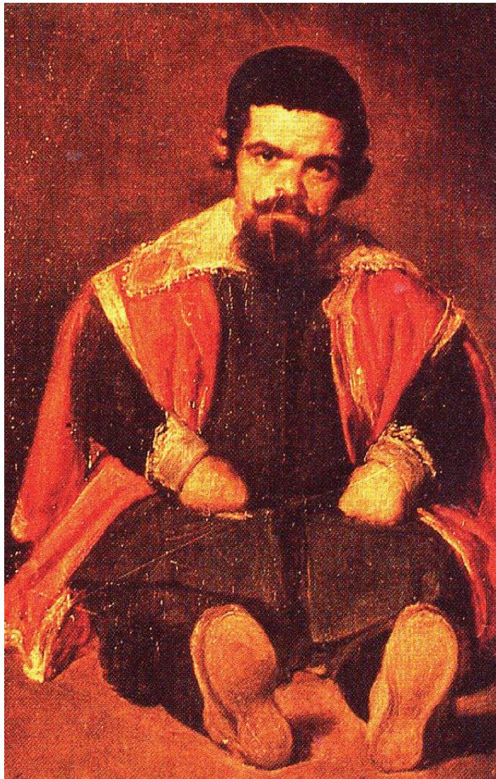
8. D. R. Velázquez, Don Sebastian de Morra – karzeł z achondroplazją, 1628, Muzeum Prado, Madryt, Hiszpania [5, 8, 10]