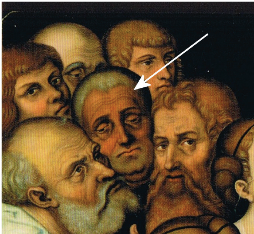
15. L. Cranach starszy, Chrystus błogosławiący dzieci , po 1537 r. Mężczyzna oznaczony strzałką ma objawy hipercholesterolemii [7], Państwowe Zbiory Sztuki na Wawelu