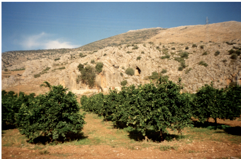
Phot. 1. Klissoura, Cave 1, Peloponnese, Greece. View of the Cave excavated by the Polish-Greek team

Medena stijena, Trebački krš [Mihajlović 1999]). This continuity is probably be related to the survival of a more open environment with steppe fauna until the beginning of the Holocene (comp. Trebački krš [Dimitrijević 1999]), possibly also connected with a greater abilities of adaptation of the groups inhabiting Montenegro. In the Mesolithic of the southern Balkans we are dealing with a variety of adaptational processes: with the adaptation of subsistence economy to environmental conditions as well as to the availability of local sources of raw materials. In the effect of the tendency towards the exploitation of a broader range of food resources from the immediate vicinity (first of all littoral and marine resources) a greater stability of settlement can be seen as compared to the Late Palaeolithic. This, in turn, could have led to a greater isolation of some groups. At the sites in the interior of the mainland continuity of Late Palaeolithic techno-typological traditions can sometimes be seen in lithic inventories such as Klissoura Cave 1 in Greece [Kaczanowska et al. 2010], at Montenegro in Črvena stijena layer VII, and Trebački krš layers Ib, Ia [Mihajlović 1999]. In the case of Klissoura Cave 1 (Phot. 1) it should be emphasized that despite the chronological hiatus between Epigravettian layers IIa–d and Mesolithic layers 5a–3 continuity is registered in the lithic industry as well as in the group of hunted game (medium ungulates, small,