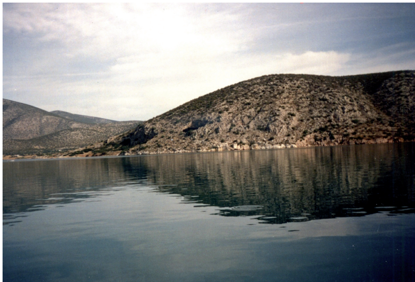
Phot. 3. Franchthi Cave, Peloponnese, Greece. View of the Cave excavated by American-French team

A different type of adaptation can be seen at littoral sites where the availability of marine resources enabled a more stable way of life as early as the end of the Pleistocene (lithic phase V/VI in the Franchthi Cave – Phot. 3) where, nevertheless, large mammals hunting continued to play the most important role. In the Early Holocene the exploitation of marine resources (predominantly Cyclope neritea molluscs) was registered in the Early Mesolithic layers (lithic phase VII), whereas in lithic phase VIII tuna was the mainstay diet and large-scale tuna fishing is registered [Perlès 1990, 1995]. The above-mentioned changes in subsistence economy correlated with the changes in technology and typology of lithic industries. At the Pleistocene/Holocene boundary the micro-burin technique, characteristic of the Epigravettian, vanished also the role of blade technique in the production of microliths was smaller and was replaced by flake technique. Gradually, flake technique began to play a major role in the production of other tool types (lithic phase VII). In time (lithic phase VIII) microliths re-appeared (but they were non-geometric), made on bladelets, sometimes resembling western Mediterraneanan flèches tranchantes . The latter continued to be produced in phase IX in the context of – again – a more conspicuous flake industry.