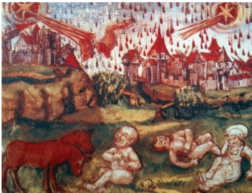
4. Artysta nieznany, 1513, miasteczko podczas kataklizmu – poprzewracane drzewa, padające z nieba krople krwi wraz z kawałkami zwierzęcego mięsa. Widoczne jest dwugłowe cielę i siedzące przy nim dziecko, przypuszczalnie z zespołem Downa, Główna Biblioteka w Lucernie [5]