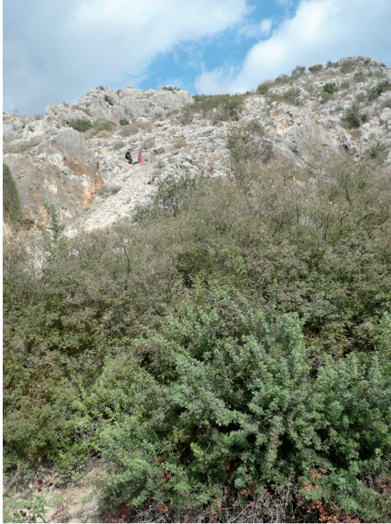
Phot. 2. Sarakenos Cave, Beotia, Greece. View of the Cave excavated by the Polish-Greek team

fast moving animals [Starkovich 2014]). At the Late Pleistocene/Holocene boundary a different process took place at sites where isolation enforced the adaptation of lithic industry to locally available raw materials. An example is the Late Palaeolithic/Mesolithic sequence in the Sarakenos Cave in Beotia (Phot. 2) [Kaczanowska et al. eds 2015] where in Mesolithic layer 4 silicified limestone was the most commonly worked raw material, whereas in Late Palaeolithic layers 5–9 a greater variety of raw materials was recorded. Layer 4 provided flake industry. Simultaneously, changes took place in subsistence economy: in the Late Palaeolithic layers large and small game hunting is registered, while in the Mesolithic layers traces of brief visits by groups who mainly hunted mammals (hare, wild boar and cervids) are registered. The layers contained large quantities of plant remains.