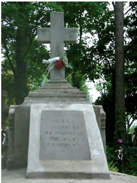
Fot. 13. Grobowiec rodziny Longchamps de Berier