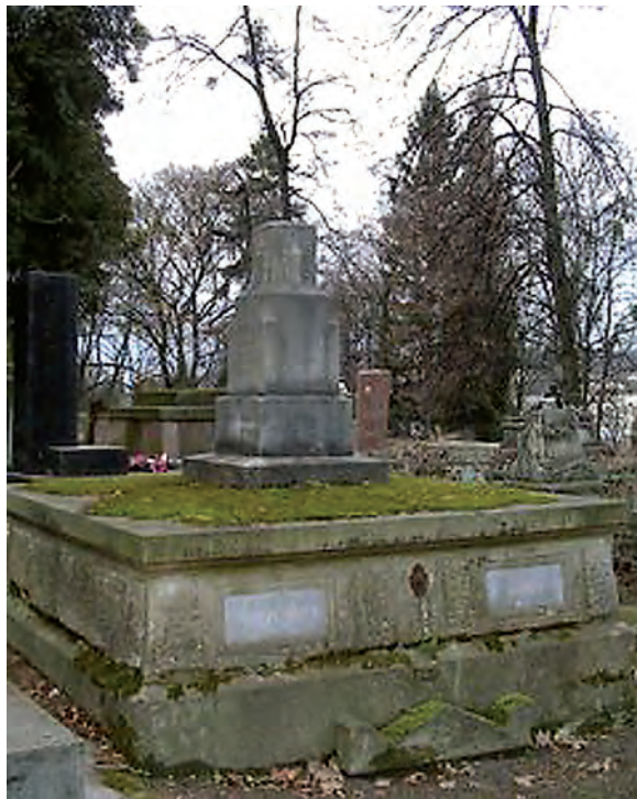
Fot. 1. Grobowiec Maurycego Kabata (1814–1890) – profesora procedury cywilnej, rektora i dziekana, adwokata krajowego

Dolińskim brakuje na grobowcu rodziny Sławików (teściów Profesora), gdzie według księgi cmentarnej i informacji prasowych profesor spoczywa.