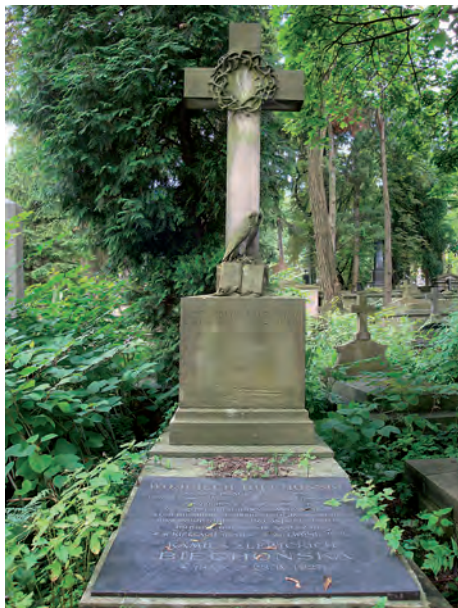
Fot. 14. Grobowiec Stanisława Szachowskiego (1836–1906), profesora prawa rzymskiego, dziekana