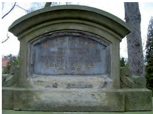
Fot. 16. Grobowiec rodziny Rappé, w którym prawdopodobnie spoczywa Wilhelm Edmund Rappé (1883–1975) – docent prawa administracyjnego