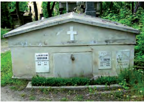
Fot. 7. Grobowiec Władysława Abrahama (1860–1941) – profesora prawa kościelnego, rektora i dwukrotnego dziekana