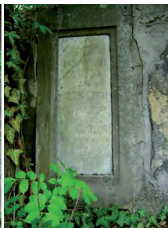
Fot. 4. Grobowiec prof. Augusta Bálásitsa (1844–1918) – profesora procedury cywilnej, rektora i trzykrotnego dziekana