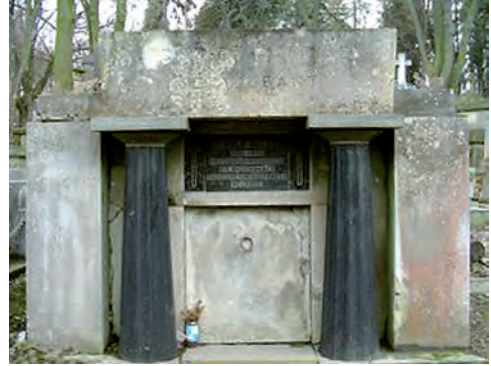
Fot. 6. Grobowiec Oswalda Balzera (1858–1933) – profesora historii prawa polskiego, rektora i dwukrotnego dziekana