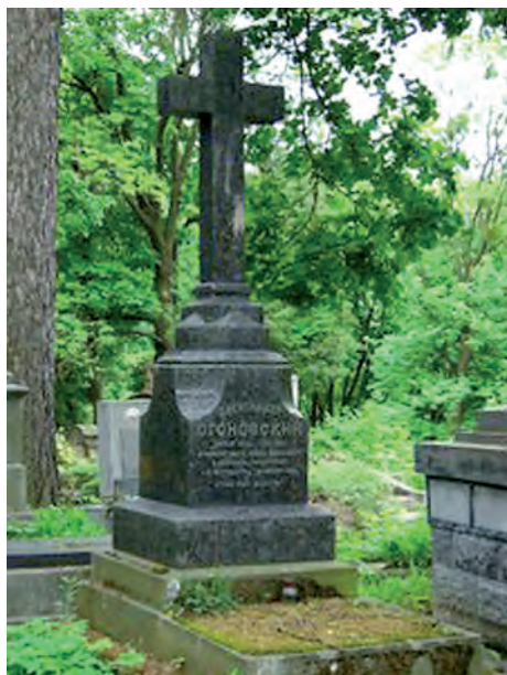
Fot. 3. Grób Aleksandra Ogonowskiego [Ohonowskiego] (1848–1891) – profesora prawa cywilnego wykładanego w języku ukraińskim, dziekana