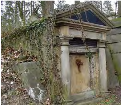
Fot. 11. Grobowiec Ernesta Tilla (1846–1926) – profesora prawa cywilnego, dziekana