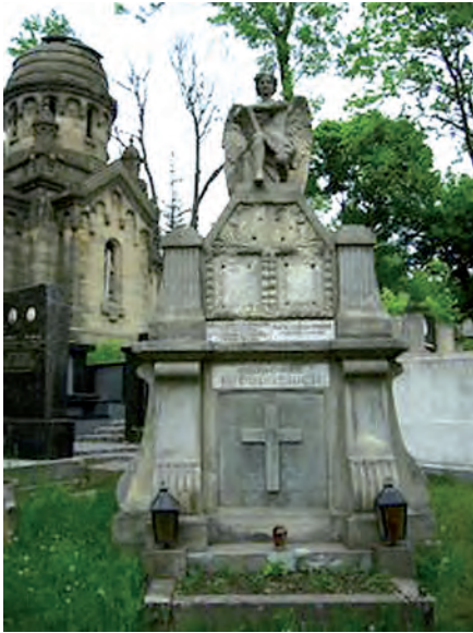
Fot. 9. Grobowiec Leona Pinińskiego (1857–1938) – profesora prawa rzymskiego, rektora