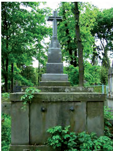
Fot. 2. Grobowiec Andrzeja Fangora (1814–1884) – profesora prawa cywilnego, rektora i siedmiokrotnego dziekana