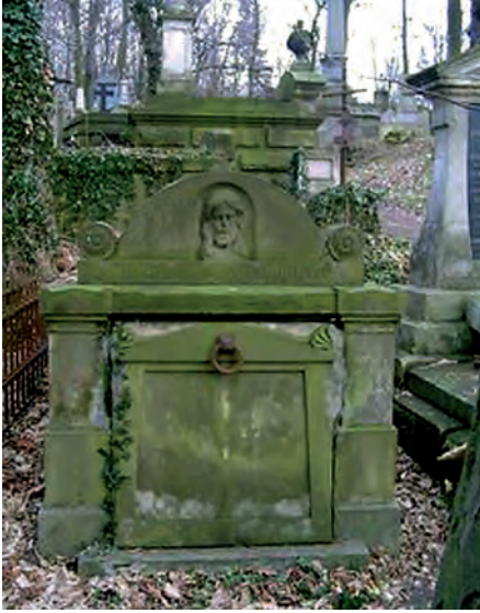
Fot. 5. Grobowiec Władysława Piłta (1857–1908) – profesora Politechniki Lwowskiej i dziekana; wykładowcy ekonomii i socjologii prawa na Wydziale Prawa UL