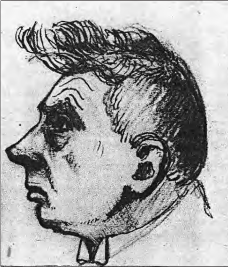
Ryc. 2. Karykatura Mieczysława Limanowskiego (rys. Stefan Narębski) (Z. Osiński 1990, s. 78)

go w Wilnie, a od 1 października 1926 r. jako profesor nadzwyczajny objął na tej uczelni Katedrę Geografii Fizycznej i kierował nią aż do II wojny światowej (od 26 września 1934 r. jako profesor zwyczajny). Nadal zajmował się on również działalnością teatralną i popularyzatorską, prowadził wykłady publiczne oraz uczestniczył w licznych zjazdach i spotkaniach, co składało się na jego zasłużoną popularność, a jednym z jej przejawów są publikowane karykatury (ryc. 2). W różnych wydawnictwach ukazywały się również jego zdjęcia fotograficzne (ryc. 3). Po wojnie został repatriowany do Torunia i podjął obowiązki profesora Uniwersytetu Mikołaja Kopernika (Kuźniar 1949; Wójcik 1962; Roszko 1975; Osiński 1990; Wąsik 1996).