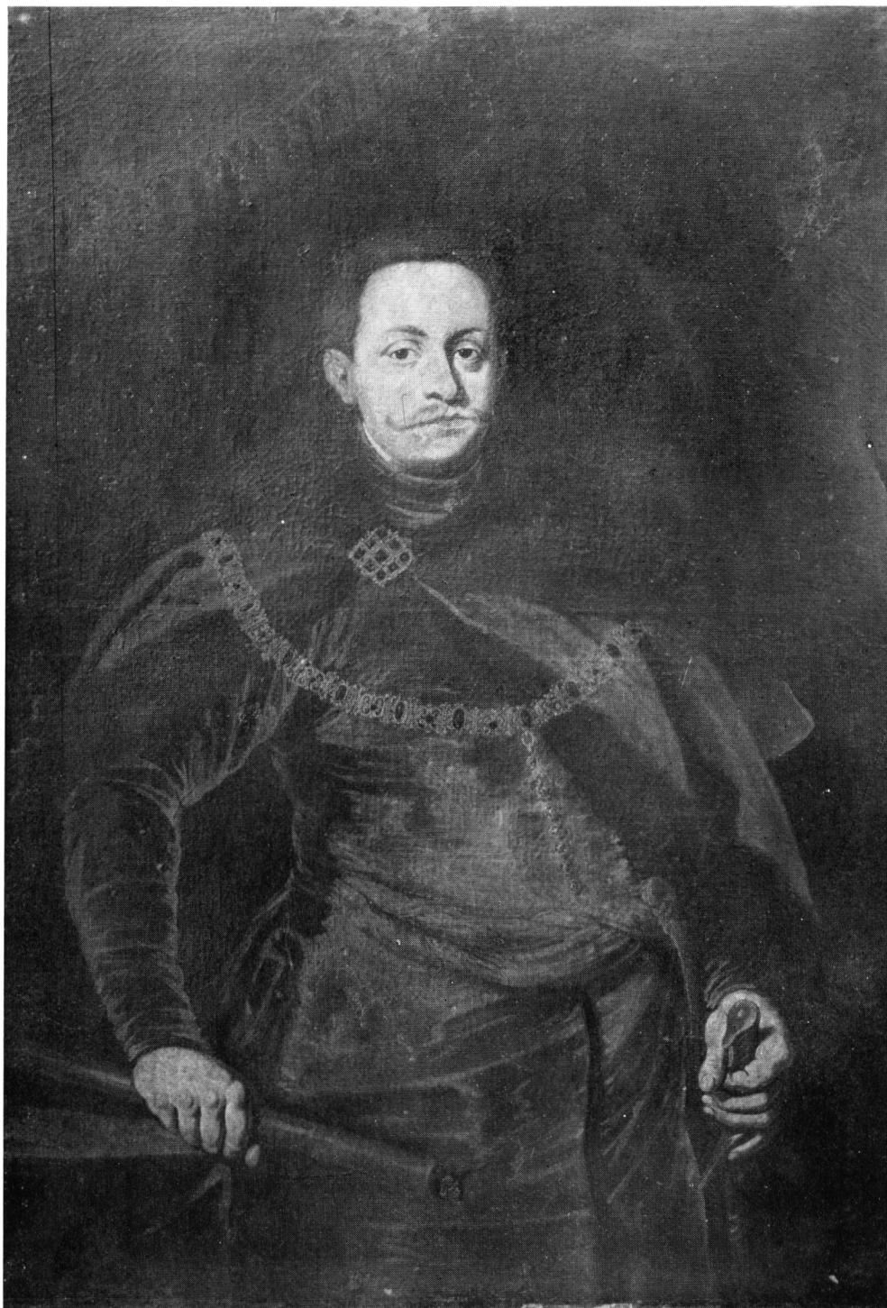
WŁADYSŁAW IV. Portret olejny. Ze zbiorów Izzydora Czosnowskiego w Ambasadzie R.P. przy Stolicy Apostolskiej.