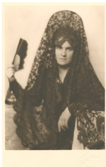
Portret Karoliny Lanckorońskiej w stroju hiszpańskim