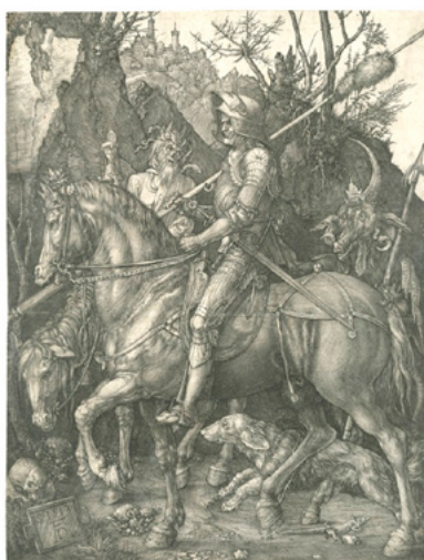
Albrecht Dürer Rycerz, śmierć i diabeł 1513