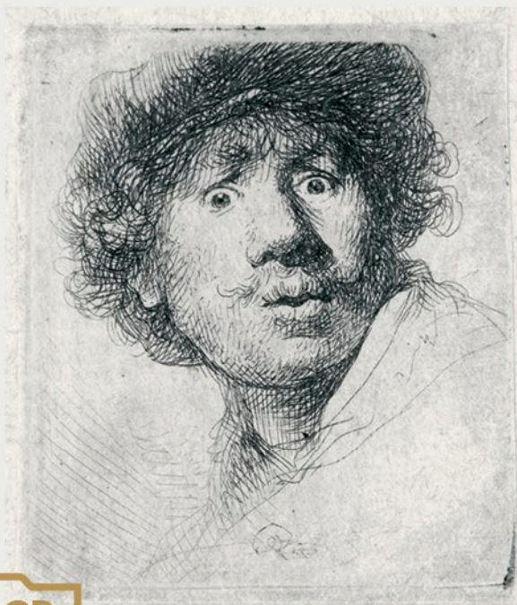
Rembrandt van Rijn, Autoportret w berecie (1630)

W 2014 roku opracowaniem i digitalizacją objętych zostało 9 tys. obiektów wyselekcjonowanych z kolekcji Biblioteki Naukowej PAU i PAN w Krakowie, Fototeki Lanckorońskich PAU oraz Archiwum Nauki PAN i PAU w Krakowie. Docelowo zakłada się digitalizację całości zbioru liczącego około 240 tys. egzemplarzy, ukazującego polskie i kolekcjonowane przez Polaków obiekty światowego dziedzictwa kulturowego.