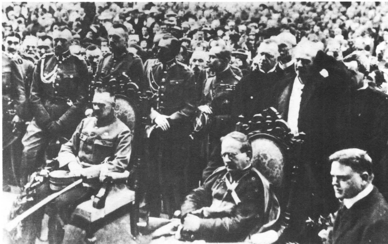
Achilles Ratti die festo Militis Poloni 12 VII 1919, praesentibus Iosepho Piłsudski et Ignatio Paderewski